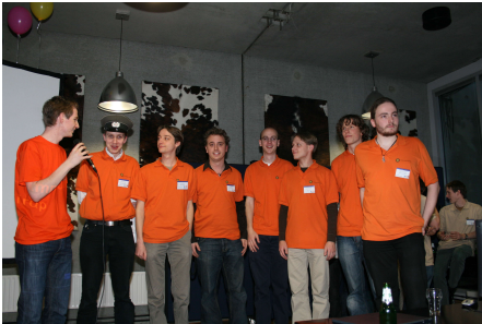
Figuur 1: De commissie van 2008 na een succesvol NWERC

We hadden het geluk dat we een excursie op het programma hadden staan die over een half uur zou beginnen. Door te blijven praten als Brugman was geleidelijk aan inderdaad iedereen vertrokken – de deelnemers hebben er niets van gemerkt. Een team uit Oxford ging uiteindelijk met de hoofdprijs naar huis. In 2008 hebben we een reprise georganiseerd, daarna heeft de universiteit van Bremen het stokje van ons overgenomen.