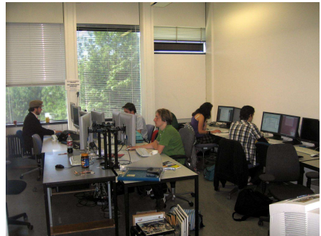
Figuur 2: De werkkamer

Door al deze positieve veranderingen zijn er tegenwoordig logischerwijs meer mensen te vinden in de gezelligheidskamer. Hier kan je gratis koffie en thee halen en tegen een gering bedrag een lolly, blikje cola, kitkat chunky of iets anders lekkers. Daarnaast zijn er nu ook noodles en broodjes papao te koop, vanwege de colleges die tegenwoordig tot 19u kunnen duren. Ook wordt het spelletjesassortiment steeds uitgebreider en kan je dagelijks vier verschillende kranten lezen.