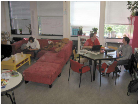
Figuur 1: De gezelligheidskamer

A–Eskwadraat heeft door de jaren heen op een boel verschillende locaties gezeten. In de jaren tachtig zijn we van de binnenstad naar de Uithof verhuisd en sinds 1997 zitten we in het Buys Ballot Laboratorium. Binnen het BBL zijn we ook een aantal keer verhuisd en tussen 2008 en 2011 zaten we in ‘tijdelijke’, kleine kamers met subtropische temperaturen.